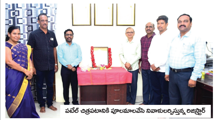
పటేల్ చిత్రపటానికి పూలమాలవేసి నివాళులర్పిస్తున్న రిజిస్ట్రార్